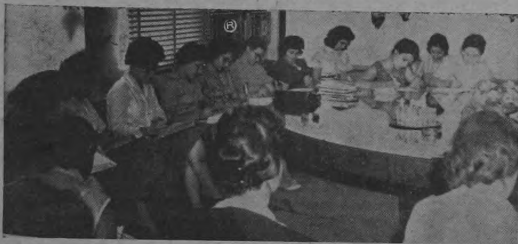
Grupo de señoritas que cursan en la Universidad estudios de Servicio Social, han iniciado el estudio de Instituciones autónomas, como parte de un programa de trabajo para la obtención de sus títulos. La presente fotografía fue tomada cuando

iniciaban el estudio sobre la organización del Instituto Nacional de Vivienda y Urbanismo, en ejecución de un plan de colaboración entre el INVU y la Universidad.